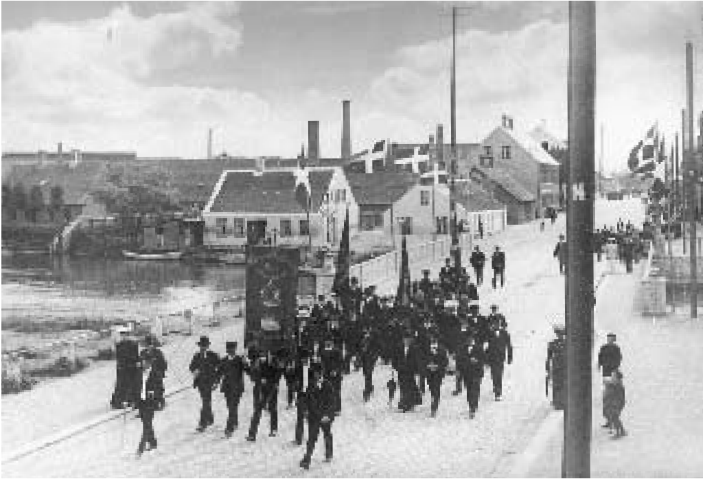
I perioden 1900-1914 holdt arbejderbevægelsen i byerne i Midt- og Vestjylland hvert år på skift en stor arbejderfest. I 1907 blev arbejderfesten holdt i Skive. Gæsterne kom med særtog til Skive H, hvor de blev hentet af deres fagfæller. Her marcherer tømrerne med faner og i deres stiveste puds over Østerbro. I baggrunden ses det ældste "Åhus" og bag det Skive Jernstøberi & Maskinfabrik.