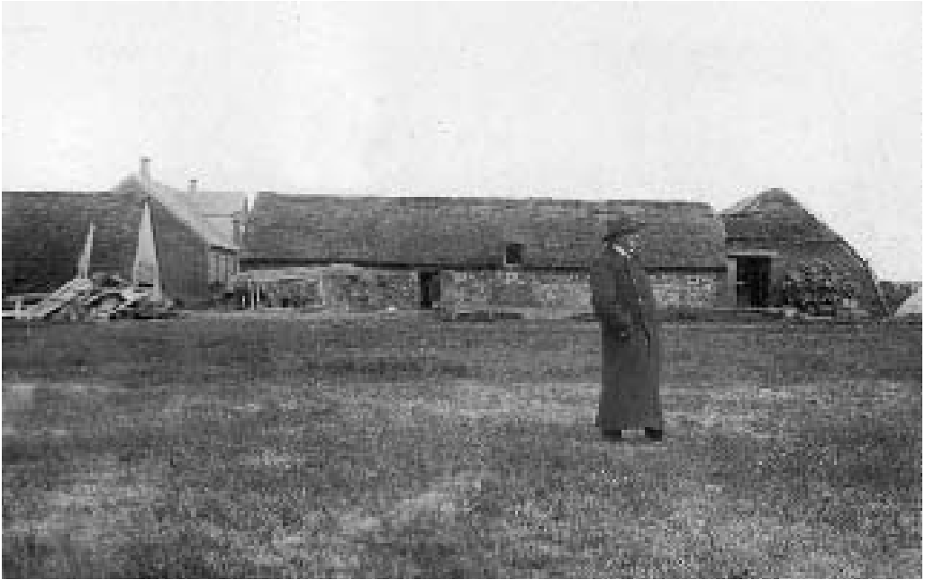
Digteren Jeppe Aakjær foran sin fødegård ca. 1910.