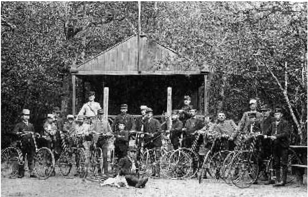
Skive Cykleklub (1889-1893) koncentrerede sig om "turistture" til bl.a. nabobyerne. Her holder medlemmer af klubben klar foran pavillionen i Liselund (Skives gamle festplads) til at køre til Viborg.

Med baggrund i cykeltriumferne opbyggede de to brødre store cykelforretninger, og i 1894-95 grundlagde de cykelfabrikken "Jyden" i Gedsted, som efter en brand flyttede til Aalestrup (i dag kommunekontor og cykelmuseum).