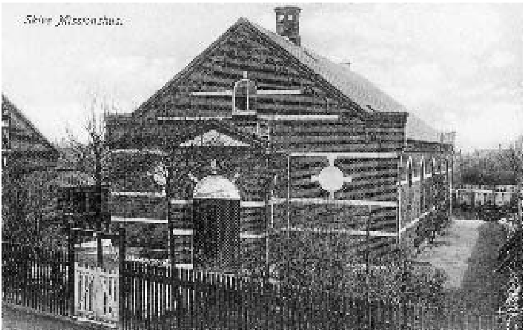
Missionshuset "Garizim" i Christiansgade i Skive ca. 1910. Over indgangsdøren står der: "Jesus er Døren".