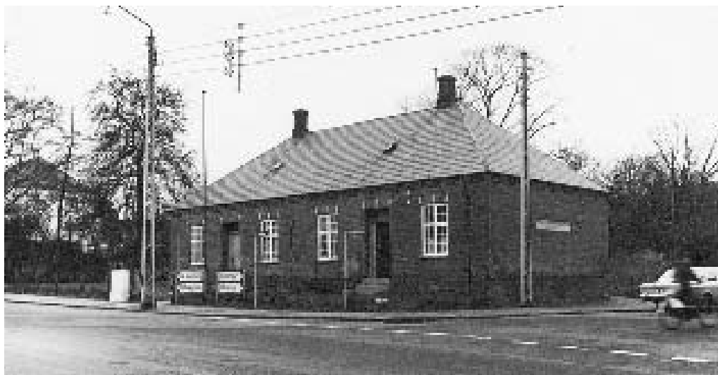
Apoteker Norgaards Arbejderstiftelse på hjørnet af Kielgastvej og Havnevej ca. 1970.

Overskuddet svarede til en fjerdedel af byggesummen på alderdomshjemmet! Det blev opført i 1890 på en grund ved Nr. Alle (nr. 12). I stiftelsen indrettedes der 9 lejligheder til ”den gamle, den værdige, den af livets møje og ærligt arbejde livstrætte arbejder”, som der står i grundstensdokumentet.