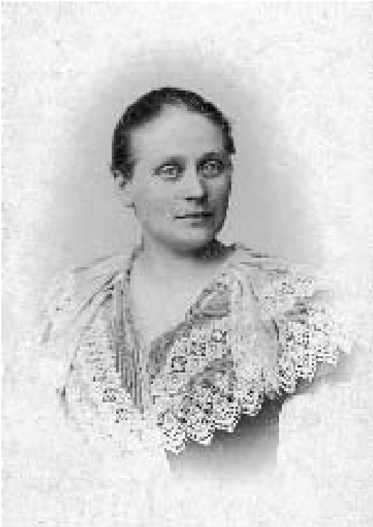
Forfatterinden Marie Bregendahl ca. 1895.