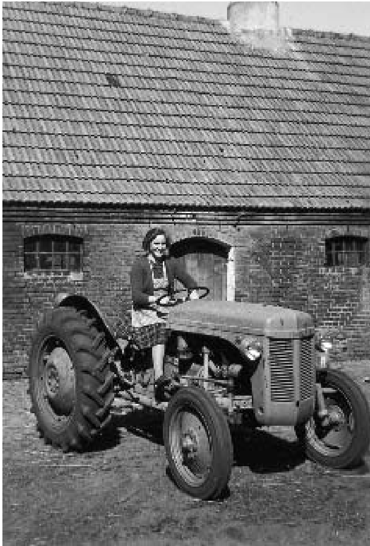
Den nye Ferguson-traktor på Bakkegården i Gammelstrup ca. 1955.

mic Cooperation). Danmark fik 1,4 milliarder kr., hvoraf landbruget fik 370 mill. kr. Pengene blev først og fremmest anvendt til indkøb af oliekgager, korn, traktorer, maskiner og brændstof, men andre ting kunne også lade sig gøre: I 1954 fik Salling Landboforening f.eks. et forsøgstærskværk finansieret af Marshall-midlerne.