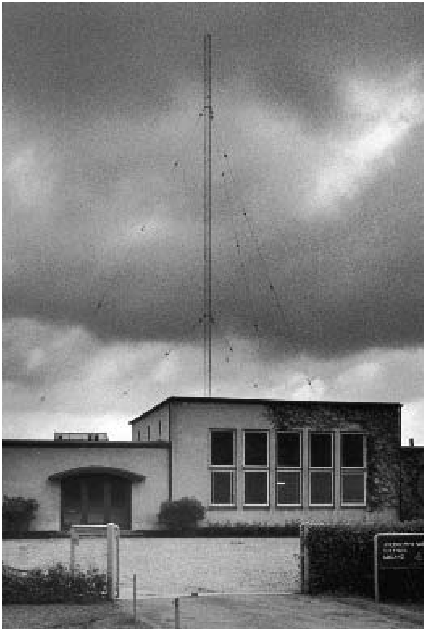
Skive Radio med byens vartegn i 1972.

I 1960'erne begyndte Danmarks Radio, som det nu hed, at sende på FM-båndet, og radiostationen blev efterhånden helt forældet. Den blev nedlagt i 1979, hvorefter postvæsenet overtog bygningerne. I 1984 blev Skive kommune ejer af byens flotte vartegn, radiomasten.