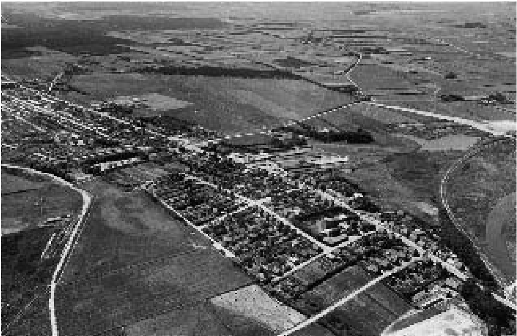
Brårup og en del af det "indlemmede" Skive søndre Landsogn: Gammelgård, Egeris, Bilstrup og Svansø ca. 1955. Midt i billedet ses Gammelgårds Teglværk og til højre den gamle Struerbane og begyndelsen til Sdr. Boulevard.