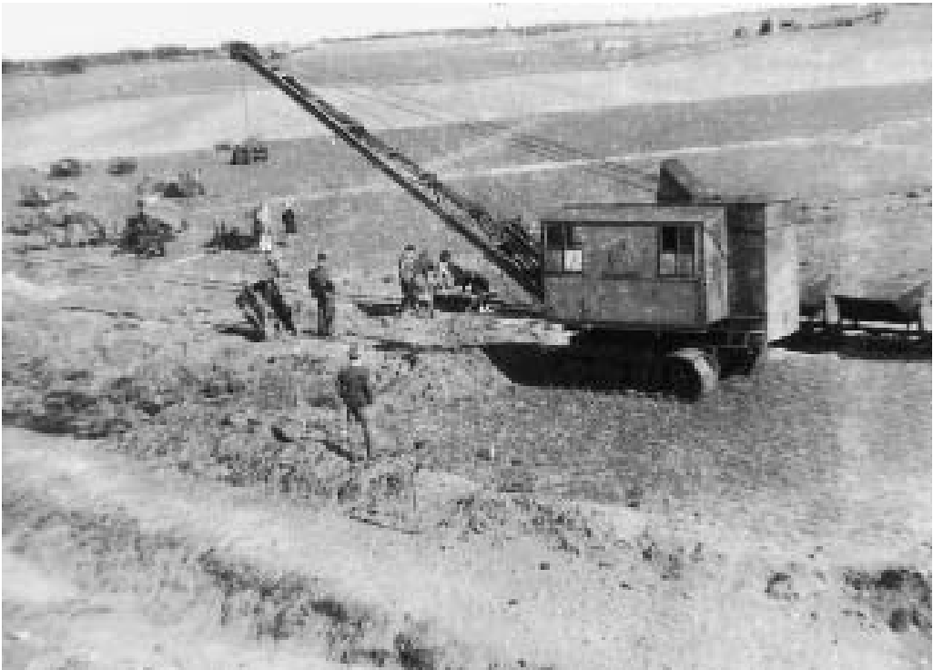
Brunkullene i Sønder Resen blev læsset på tipvognstog og kørt til sortering efter størrelse. Foto ca. 1950.

Mange arbejdere byggede primitive skure og hytter uden for Sdr. Resen by. Her fandtes også en kantine og KFUM-hjem, hvor arbejderne kunne spise og tilbringe fritiden uden alkohol. Når arbejderne nøjedes med de primitive forhold, skyldtes det, at ingen vidste, hvor længe brunkulseventyret ville vare.