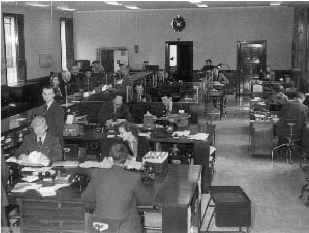
Salling Banks ekspeditionslokale midt i 1950'erne.

måtte fordele udlånene og valgte at prioritere de produktive erhverv: Landbrug, industri og håndværk. På trods af denne "rationering" kneb det at følge med: I 1953 måtte Salling Bank trække på kreditten hos hovedbanken, Landmandsbanken, for at skaffe penge til lånerne.