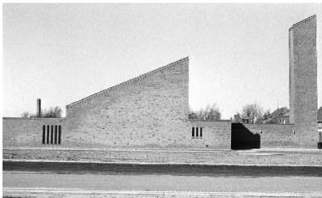
Stoholm kirke ved indvielsen i 1971.