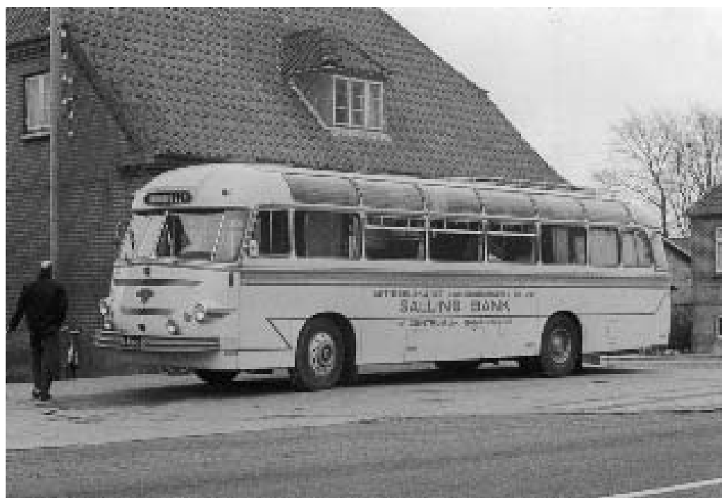
Salling Banks første bankbus - en ombygget turistbus - holder i Fly ca. 1967.

I 1972 fordoblede banken aktiekapitalen til 12 mill. kr. For første gang blev der udloddet fondsaktier - 3 mill. kr. - til aktionærene, der kunne købe den anden halvdel til kurs 105. Målet var, "en mere ligelig fordeling af aktiekapital og reserver," forklarede bankens formand, Hartvig Bregendahl. Lige siden bankens tilbagekøb i 1926 havde man - i stifternes ånd - fulgt den politik at henlægge en stor del af overskuddet til reserver, og det havde medført, at bankens reserver langt oversteg aktiekapitalen, men nu valgte man at uddele en del af reserverne til aktionærene som friaktier.