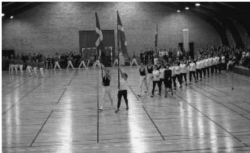
Indmarchen ved indvielsen af Sallinghallen den 20. november 1966.

Hvor skulle hallen ligge? Det var et spørgsmål, der var næsten lige så vigtigt, som hvor man skulle skaffe pengene fra! De store byer i Salling: Roslev, Jebjerg, Breum,