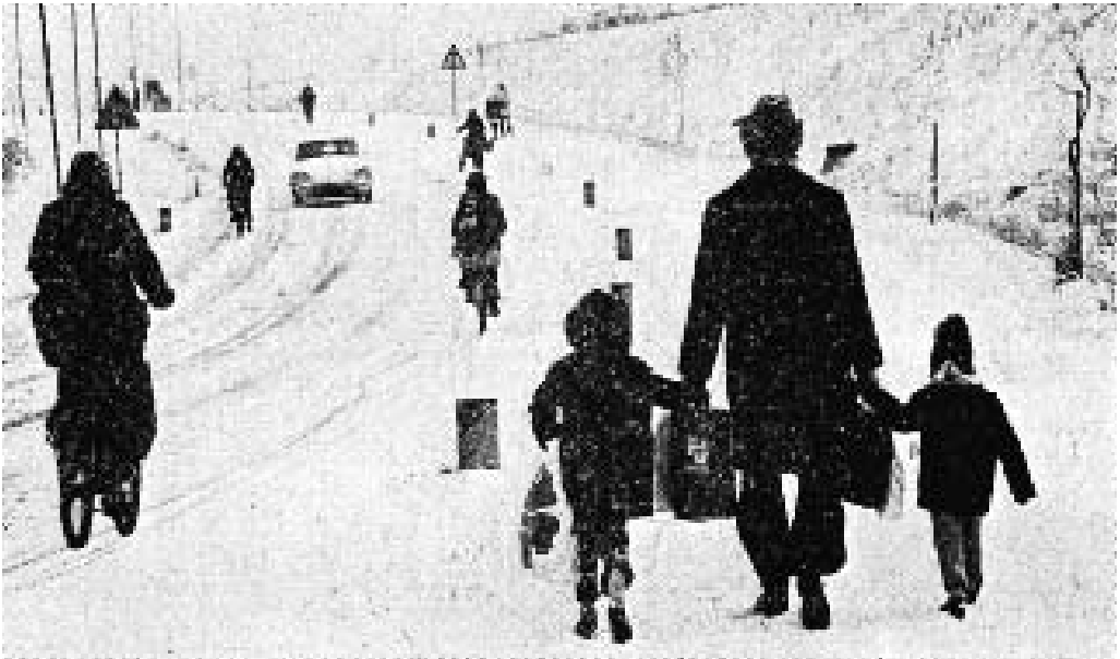
Sdr. Boulevard på den første bilfrie søndag i november 1973. Det var snevej, og det lagde en yderligere dæmper på trafikken.

Folk, der skulle på arbejde, f.eks. læger og sygeplejesker, kunne få køretilladelser. I Skive kommune fik 62 tilladelse, i Sundsøre 66, i Sallingsund 43 og i Spøttrup ca. 50. Tog, rutebiler og taxaer kørte også. Såvel banegården som rutebilstationen havde flere rejsende end normalt, og Skives 22 taxaer havde en forrygende dag. Telefonen kimedede uafbrudt, og der måtte to telefonpassere i gang for at fordele kørslen. Politiet snuppede kun en enkelt ulovlig bilist, der ikke kunne lade være med at tage bilen hen efter morgenbrød, men man havde ellers nok at gøre med at besvare forespørgsler i forbindelse med køretilladelser m.m.