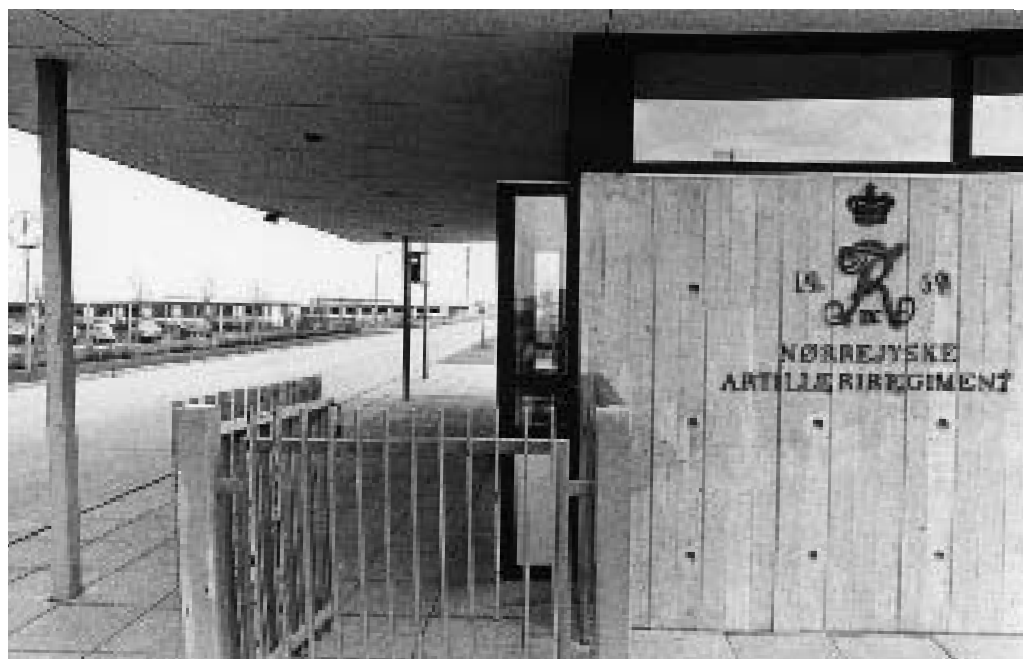
Skive kaserne, hjemsted for Nørrejyske Artilleriregiment 1969-2000.

Kaserneflytningen kom til at koste skatteborgerne i Skive penge, for Skive Byråd blev nødt til bl.a. at oprette et gymnasium i Skive, så officerernes børn kunne få en studentereksamen uden at skulle rejse til en af nabobyerne. For at lette smerten for forsvarets ansatte ved at skulle flytte til Skive, blev det bestemt, at de havde forkøbsret til byggegrunde i det sydlige Skive.