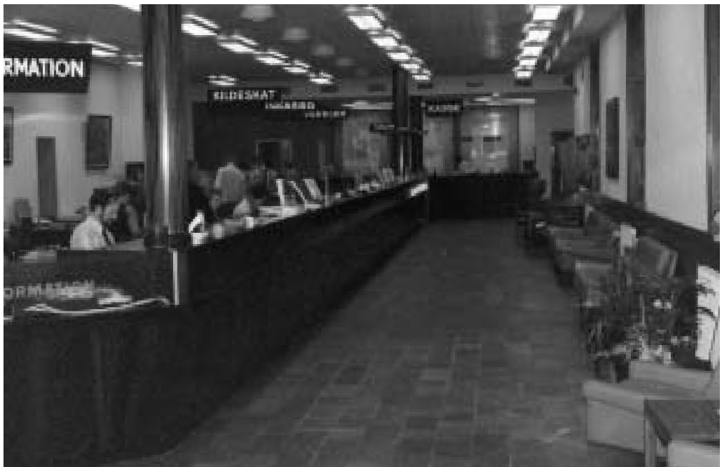
Salling Banks ekspedition efter ombygningen i 1972-1973.

Der viste sig hurtigt en vis opposition til sammenslutningen blandt erhvervsfolk i Skive. ”Oppositionen” mente ikke, at den sammensluttede bank kunne magte større opgaver end før, fordi de to banker allerede samarbejdede om de største engagementer. Der var mere brug for at få en filial af en af de københavnske hovedbanker, som kunne tilføre egnen ny kapital, eller at en af de to banker blev opkøbt af en københavnerbank. Nogle