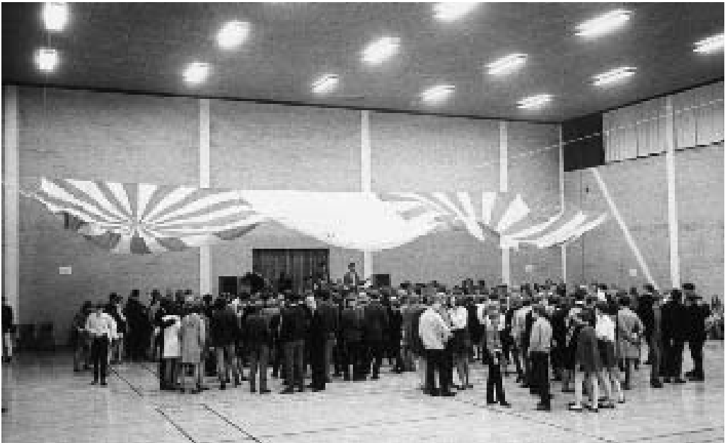
Beatkoncert i Skivehallen den 1. april 1968.

mode slog igennem hos kvinderne, mens man skal et godt stykke ind i 1969, før det lange hår blev moderne hos de unge mænd.