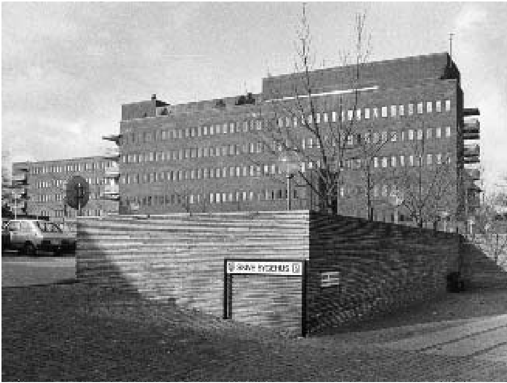
De nye afdelinger på Skive Sygehus.

naboen, Nordre Skole, til Viborg Amt, for at området kunne bruges til yderligere sygehusudvidelser. Amtet gjorde et godt køb, for Skive byråd lagde stor vægt på at bevare sygehuset i Skive!