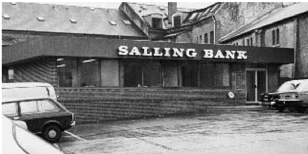
I 1972-1973 blev Salling Bank udvidet med en tilbygning på 150 m 2 i to plan mod gården. Her fik bankens direktion og interne revision kontorer.

I 1971 blev kreditloftet lempet, og nu kom der for alvor fart på tingene! I 1971 steg bankens omsætning med 39% - det er rekord! og i 1972 med 25% - men så ændrede forholdene sig igen efter oliekrisen udbrud i 1973. Folk blev mere forsigtige og begyndte at spare op, men den stigende private opsparing kunne ikke opveje erhvervslivets uddrag. Indlånene i banken gik ned med 2 mill. kr. ”Kraftig stagnation” - sådan karakteriserede banken forholdene! Usikkerheden bredte sig: I 1975 steg opsparingen med 28%, mens udlånene faldt med 7,5%. Det var især byggelånene, der var mindre efterspørgsel på. Den stigende arbejdsløshed fik folk i byggetanker til at tænke sig om en ekstra gang!