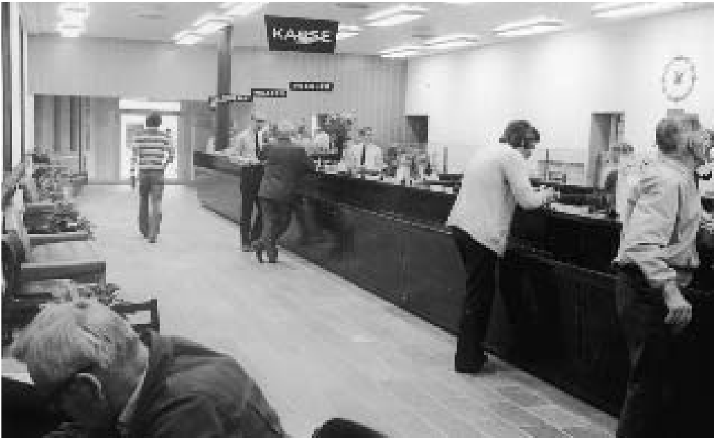
Salling Banks ekspeditionslokale efter ombygningen i 1972-1973.

gik så vidt, at de truede med at flytte deres bankforretninger, hvis sammenlægningen blev til noget.