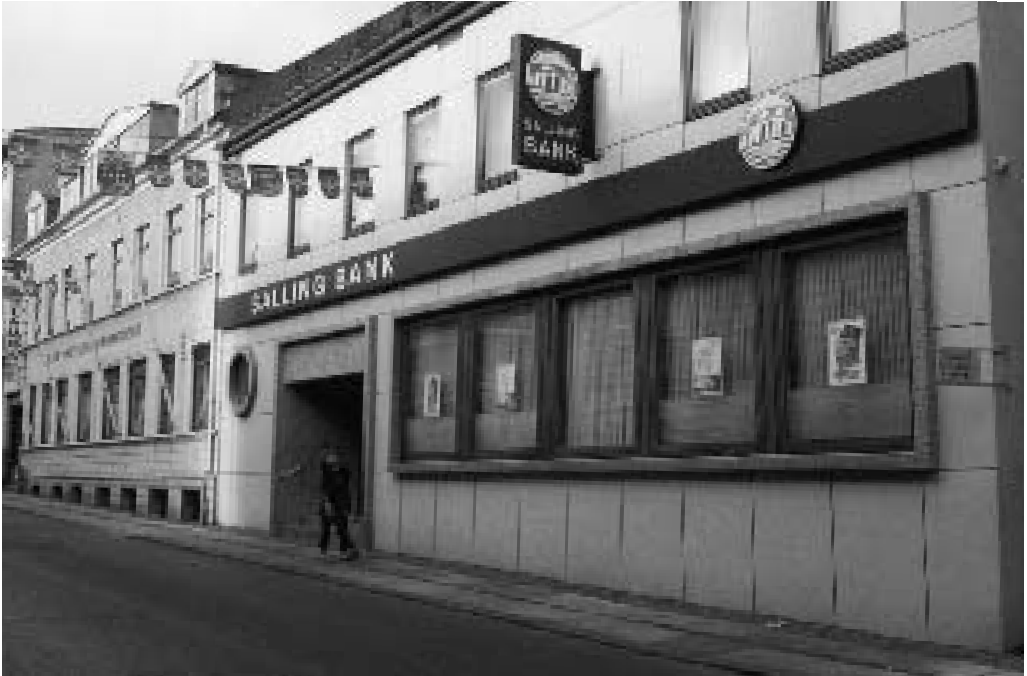
Salling Bank efter ombygningen i 1972-1973.