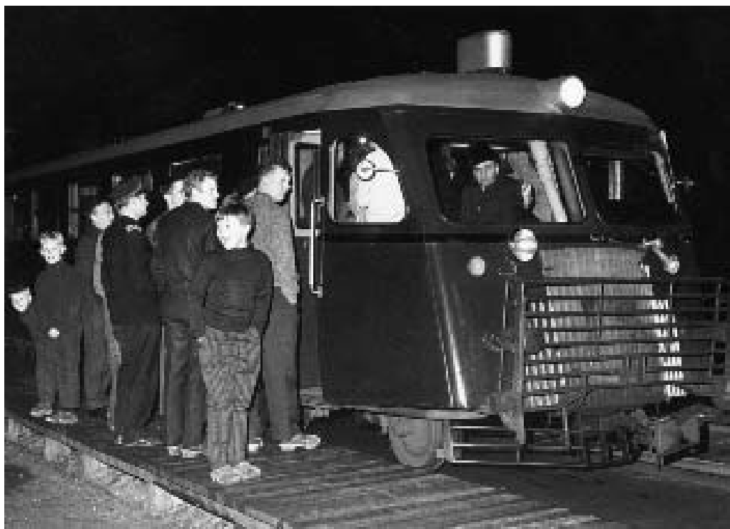
Sidste tog på Skive-Vestsallingbanen den 31. marts 1966.

Men så kom 1960'erne og privatbilismens eksplosion! Fra 1960 til 1965 blev banens underskud fordoblet, og da staten afviste at fortsætte med at give tilskud til banedriften, var banens skæbne beseglet. Den 31. marts 1966 kørte det sidste tog på banen, der her-