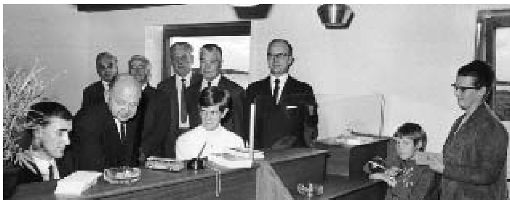
Indvielsen af Fur Banks nye bygning i 1971.

Den første september 1972 blev der skrevet bankhistorie. Elleve midt- og vestjyske banker – heriblandt Salling Bank - åbnede en fælles filial i København. De elleve banker var i forvejen fælles om edb-centralen i Herning.