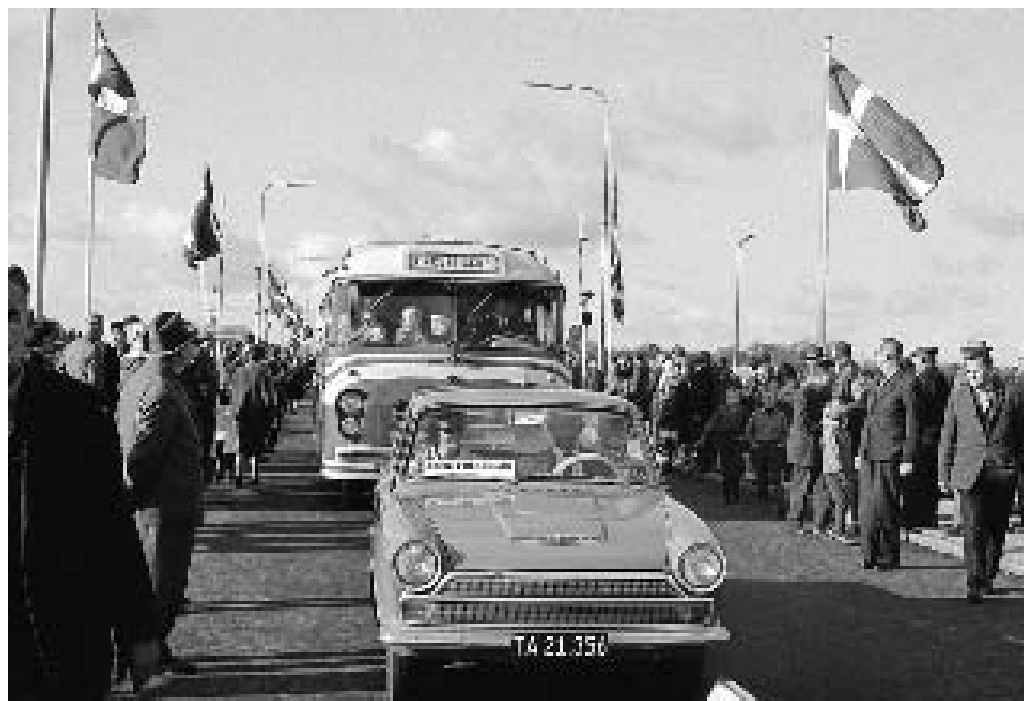
De første biler passerer Virksunddæmningen den 24. oktober 1966.

Vestjylland protesterede. Til gengæld blev der udført flere mindre inddæmninger, bl.a. blev der bygget en dæmning ved Sønder Lem Vig, hvorefter vandstanden blev sænket bag dæmningen.