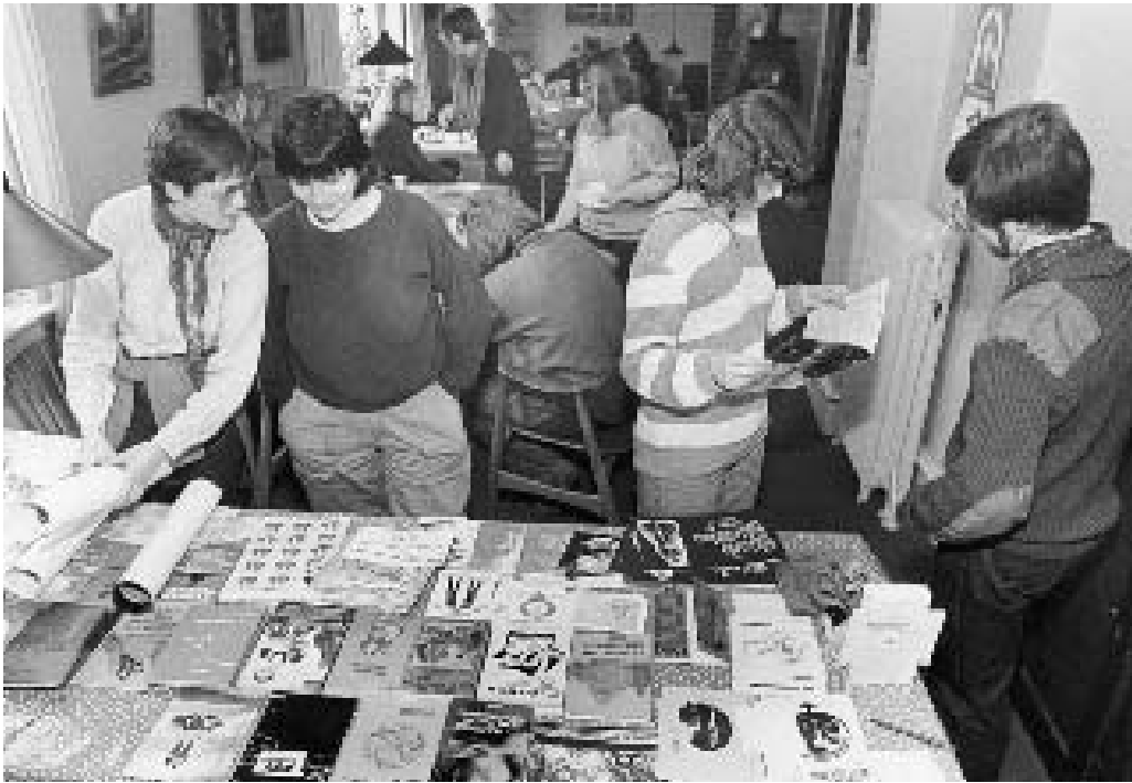
Skive Kvindegruppe var en af de mange grupper og foreninger, der holdt i Medborgerhuset på Resenvej 10. Her fejrer gruppen "8. marts fest" i 1985.

bevilge et årligt driftstilskud, så der kunne ansættes en daglig leder. Den overordnede ledelse fik en bestyrelse, valgt af brugerne, suppleret med et byrådsmedlem.