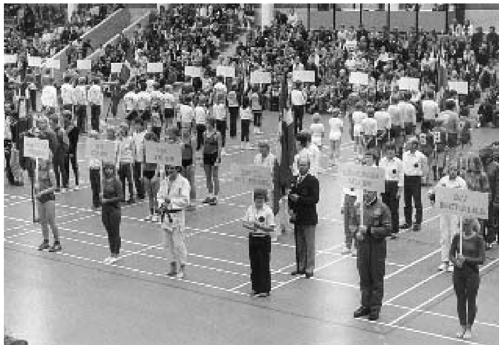
Indvielsen af Skivehal nr. 2 i 1981 blev markeret med et stort arrangement, hvor medlemmer af Skive Idrætsforbunds foreninger marcherede ind i hallen med deres faner.

I 1968 åbnede Skive-Hallen efter næsten 25 års forarbejde. Den skulle bruges til idræt, udstillinger og koncerter m.m., og det blev hurtigt et problem for de idrætsforeninger, der brugte hallen, at træningen måtte aflyses, når den skulle bruges til andre formål. Der var også grænser for, hvor store udstillinger og arrangementer, der kunne holdes i hal-