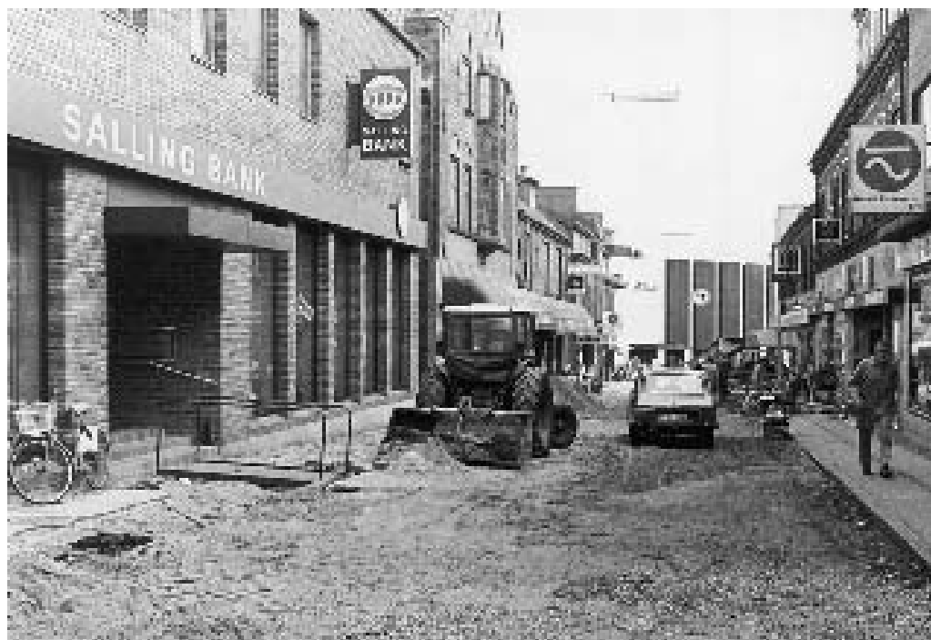
I 1979 blev Salling Banks facade mod Frederiksgade skalmuret med røde mursten. Her ses banken under omdannelsen af Frederiksgade til gågade i 1982.