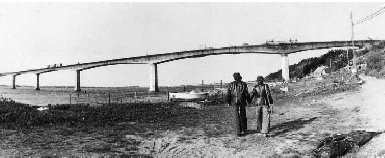
Den 1730 meter lange Sallingsund fotograferet i 1977.

rik, trafikminister Kjeld Olesen og formanden for Folketingets trafikudvalg, Otto Mørch.