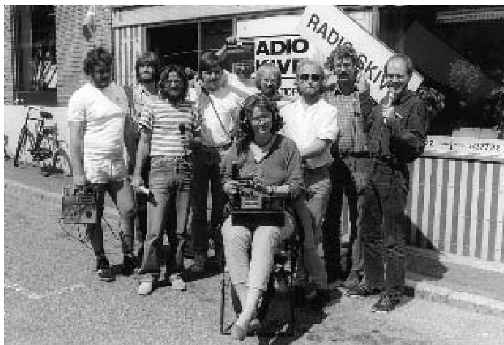
Ansatte og frivillige uden for Radio Skive i Vestergade 10, juni 1985.