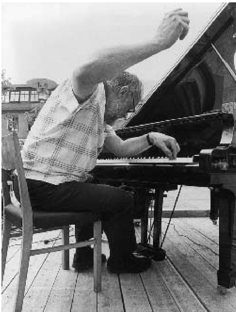
Skiveegnens borgere fik mange oplevelser under Skives 650 års jubilæum. En af de store begivenheder var "multimusikfestivalen", hvor komponisten og pianisten Niels Viggo Bentzon slog til på et flygel på Torvet i Skive.