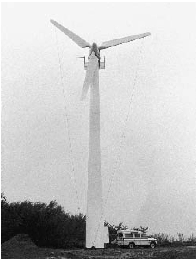
Jebjerg Møllelaug I/S, bestående af 11 familier, rejste i 1984 en 23 meter høj 55 kilowatt Vestas vindmølle ved Roslevvej. Fotografiet er taget, lige før wirerne, der holdt møllevingerne, blev fjernet og møllen sat i gang.

De små vindmøller – ”klapsejlerne” – på ladetage prægede det danske landskab i første halvdel af 1900’allet. De blev taget ud af drift i takt med udbredelsen af elektriciteten, og i 1950’erne var de stort set ude af brug.